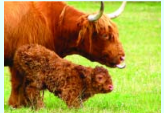
Meine Mama Rine ist glücklich, dass wir beiden zusammenbleiben können!