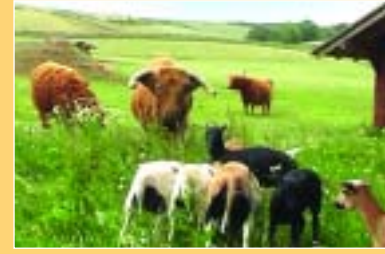
Guten Tag! Wir sind's, die Schafe von nebenan. Schön, dass wir euch besuchen dürfen!