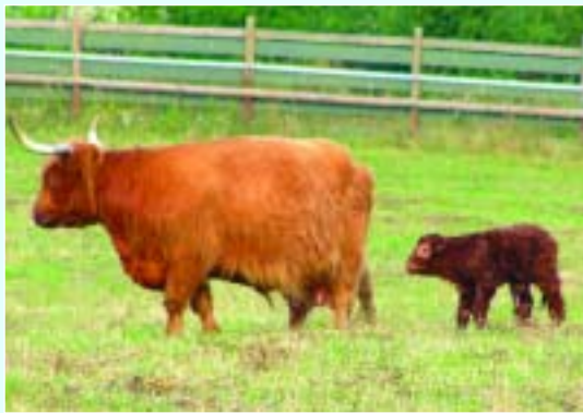
Hei, Mama, bleib mal stehen! Ich hätte jetzt so langsam mal Hunger!