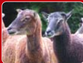
Neue Bewohner auf dem friedvollen Land