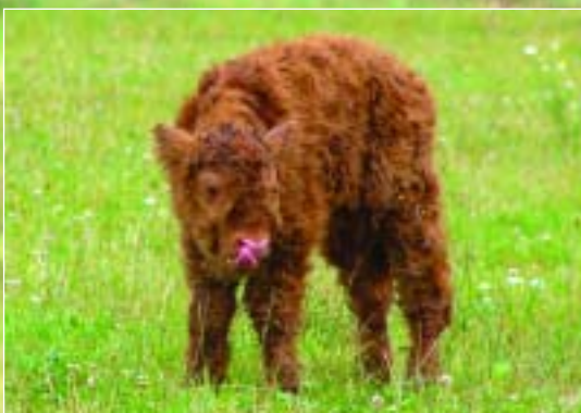
Hmmm! War das köstlich!