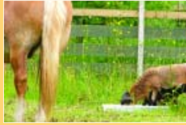
Sehr freundlich, dass ihr uns von eurer Futterschale essen lasst! Super lecker übrigens...