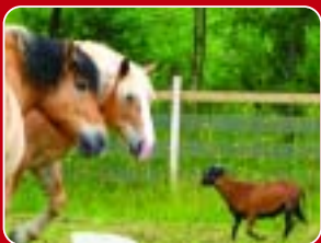
Ein Besuch auf der Nachbarweide

Mit Gratis- Poster zum Herausnehmen und Aufhängen