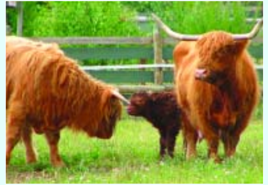
Na großer Bruder? Willst du mit mir spielen?

»Wir danken euch, dass wir auf dem friedvollen Land unserer Art und unserem Wesen entsprechend leben dürfen. Hoffentlich können noch viele unserer Freunde hierher gerettet werden. Hilfst du uns?«