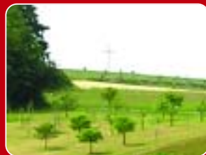
Der Biotopverbund wächst weiter