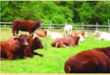
Wir Hinterwälder- und Salers-Rinder liegen längst gemeinsam auf der Weide.