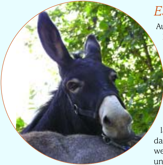
Erst mal eine Verschnaufpause einlegen...