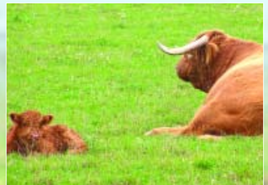
Schaut mal, das ist mein Papa Maese! So groß werde ich auch mal. Mindestens!