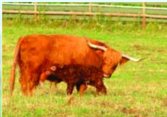
Juhuu, die Milchbar hat geöffnet...!